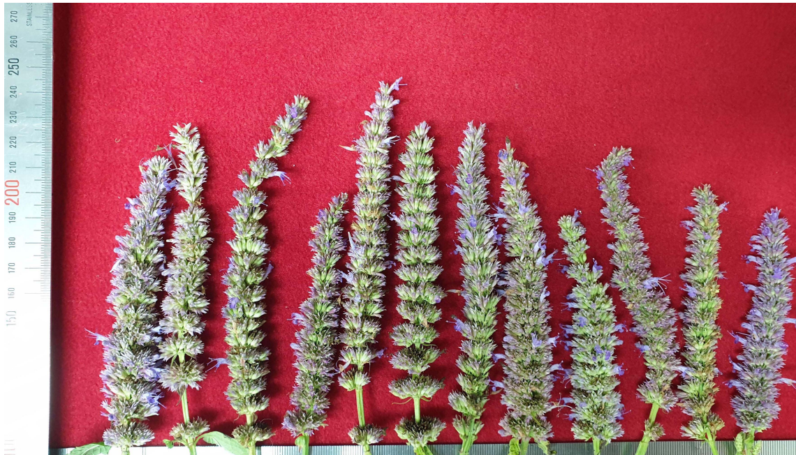
Fig. 1. Inflorescence of Korean mint Agastache rugosa (Fisch. & C. A. Mey.) O. Kuntze.