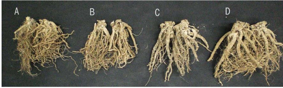
Fig. 2. Effects of harvest time on the root part of Dipsacus asperoides Wall. A; early October, B; middle October, C; late October, and D; early November.

초까지 지상부의 초장, 근경 및 건물중은 차이를 나타내지 않았으나, 지하부 건근중은 시간이 지남에 따라 증가하여 11월 초에 가장 높았다고 보고되었다 (Kim et al. , 2015).